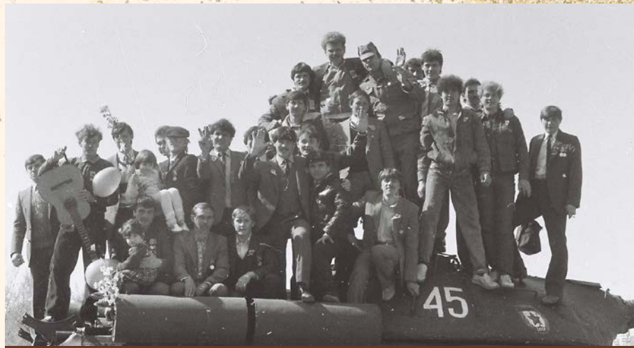
Ветераны Афганистана-белгородцы, 1986 г.

Многие белгородцы, служившие срочную службу в Афганистане, до призыва в советскую армию работали на заводе «Энергомаш». После окончания срока