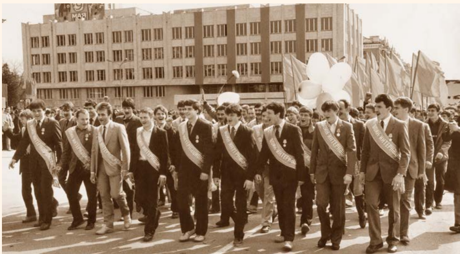
Воины-интернационалисты клуба «Каскад» на демонстрации 1 мая 1987 года в колонне ПО «Энергомаш»

отических мероприятий, экскурсий. Администрация завода поддерживала «афганцев» во всех начинаниях: от проведения в пионерском лагере «Юность» игры