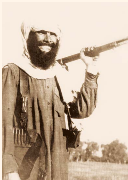
Моджахед с винтовкой Бур. Провинция Пактия. 1982 г.

Никогда раньше советским войскам не приходилось вести боевые действия с противником на его территории, который широко применял бы партизанскую тактику. Если учесть, что эта война была без тыла и фронта, когда противник повсюду, а чаще там, где его меньше всего можно было ожидать, то значительно усложнялись не только условия ведения боевых действий, но и само пребывание 40-й армии в Афганистане. Не поддержали решение об отправке Советских