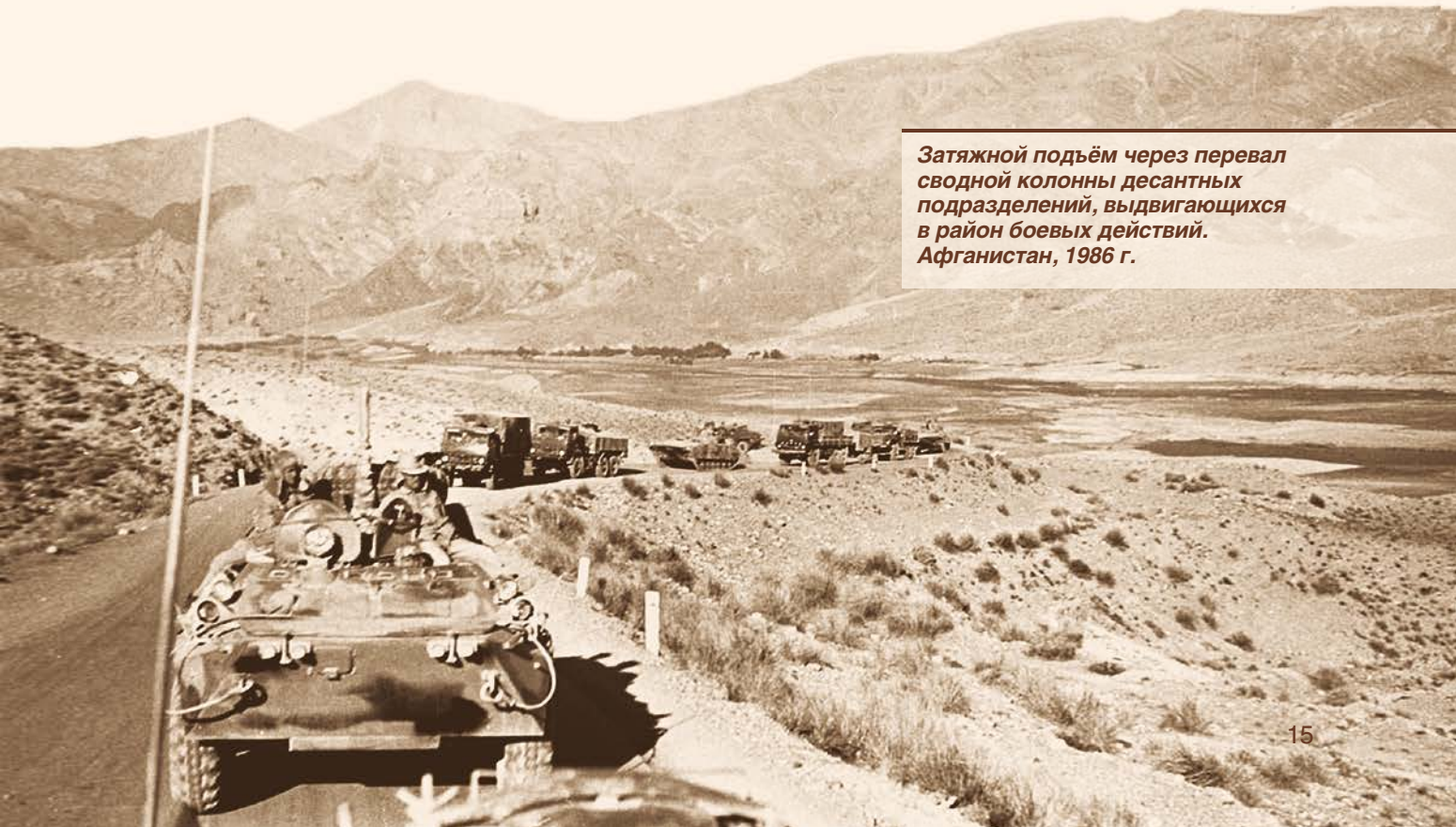
Затяжной подъём через перевал сводной колонны десантных подразделений, выдвигающихся в район боевых действий. Афганистан, 1986 г.

районами. Были обустроены 862 заставы и поста, из них 186 сторожевых застав и 184 поста располагались вдоль коммуникаций (с учетом выносных наблюдательных постов, их сеть превышала 1100 наименований). Стандартное обустройство заставы сводилось к возведению каменных или глинобитных стен по всему периметру заставы. Минированию в несколько рядов осветительными и противопехот-