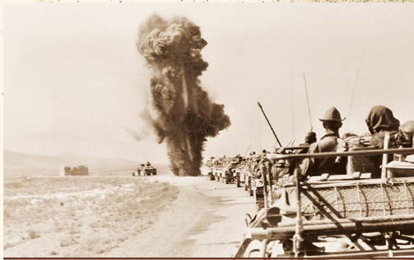
Инженерно-сапёрный взвод снимает фугас (подрыв на месте закладки) при движении боевой колонны 357 гв. ПДП. Провинция Пактия, 1987 г.

История не прощает беспамятства и все попытки стереть в общественном сознании наше ближайшее героическое прошлое, в том числе и трагедию Афганской войны, неминуемо ведут к гражданской пассивности, душевному безразличию и приведут к краху. И сегодня, в канун тридцатилетия вывода наших войск из Афганистана, когда исчезли все идеологические клише и политические запреты советской конъюнктуры, у нас появилась возможность беспристрастно взглянуть на события тех лет.