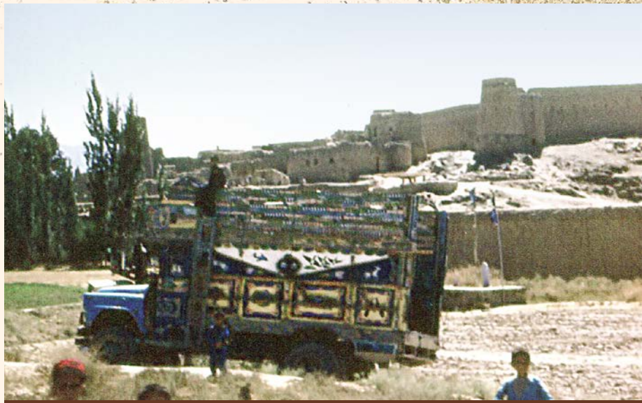
Крепость Джаржи – место расположения батальона «зелёных» в районе Алихейль. Афганистан, 1985 г.