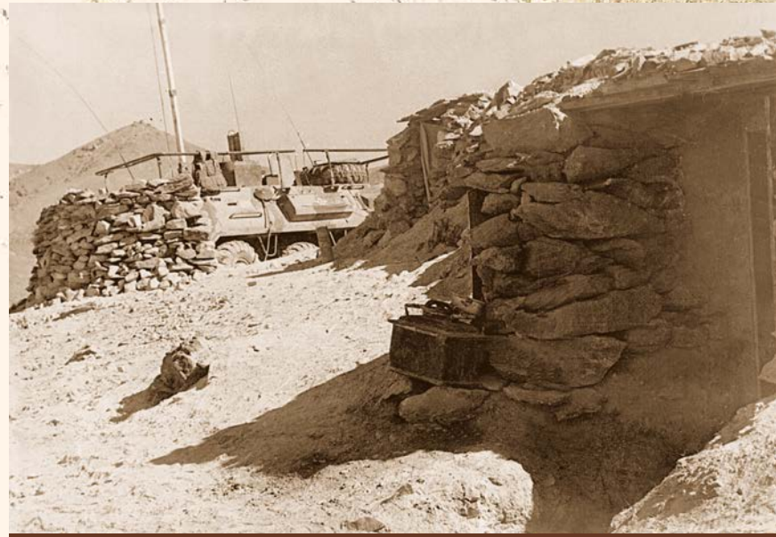
Обустройство сторожевой заставы на высоте 23-92. Провинция Парван, 1986 г.

Для контроля над местностью были развернуты сторожевые заставы и посты, находившиеся вокруг ключевых объектов: на дорогах, у мостов и перевалов. С них велось постоянное наблюдение за прилегающими