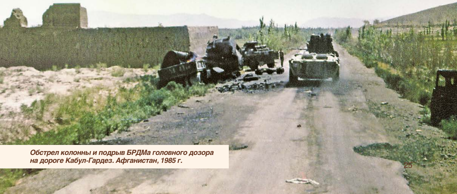
Обстрел колонны и подрыв БРДМа головного дозора на дороге Кабул-Гардез. Афганистан, 1985 г.

Виктором Лосевым смело гордится Белгородчина. Посмертно, 23 ноября 1981 г. он награждён орденом Красной Звезды, а 5 мая 1989 г. медалью «Воину-интернационалисту от благодарного афганского народа». 1 декабря 1985 г. был создан военно-патриотический клуб памяти Виктора Лосева ЦДО для детей «Юность» (педагог-организатор Г.А. Растворцева), 12 ноября 2009 г. его именем названа улица в г. Белгород.